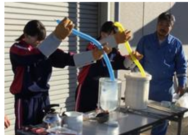
四日市オキシトンにて低温物理実験