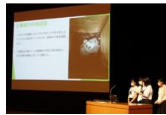
課題研究中間発表会