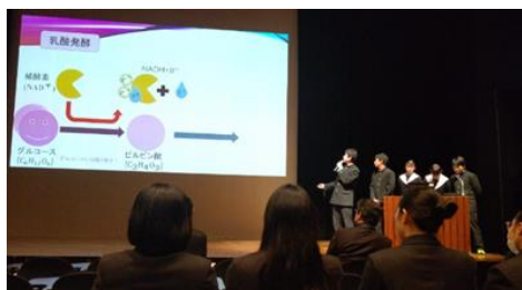
(一昨年度) 口頭発表の様子

例年、2月に三重県総合文化センターで行われた『みえ探究フォーラム』へ、2年理数科課題研究から口頭発表2グループ、ポスター発表1グループが出演しています。昨年度はオンラインでの開催でしたが、口頭発表部門で「桑名を液状化現象から救え！」が最優秀賞、口頭発表部門で「結晶と逆圧電効果の関係について」、ポスター発表部門で「未来のプラスチックを作ろう」が優秀賞を受賞しました。また、例年理数科1年生の生徒が小学生向け科学体験講座のスタッフとして参加していますが、こちらは昨年度は残念ながら中止となりました。