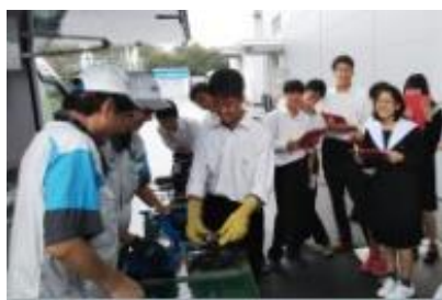
NTN グリーンパワーパーク

1・2年生は、秋には学校を離れて企業や博物館、大学等での研修に参加します。昨年度は残念ながら中止となりましたが、一昨年度は1年生は NTN 先端科学研究所・グリーンパワーパーク、名古屋工業大学を訪問しました。2年生は(株)四日市オキシトンにて、液体窒素・液体酸素を用いた低温物理実験と見学研修を実施しました。