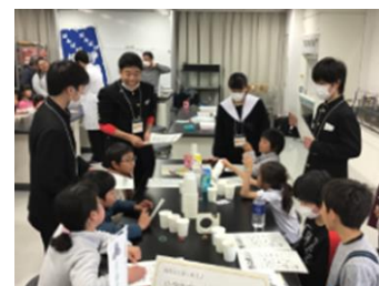
小学生対象科学実験講座