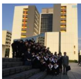
名古屋工業大学にて