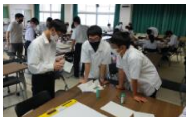
グループ別課題実験演習

2年生の12月には、希望生徒を対象にタイにて海外研修を実施する予定でしたが、残念ながら新型コロナウイルス感染症の流行により中止となりました。代わりにリモートで台湾の高校生との交流を実施しました。