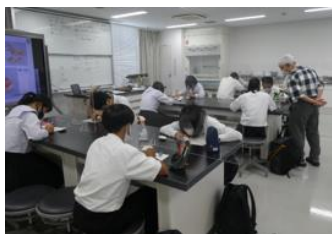
三重総合博物館研修