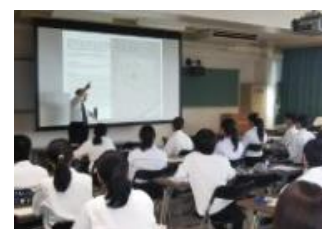
大学の先生を招いての講演会